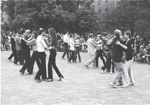
Gespräche mit Schülern und Lehren (2000) Stefan Hayn