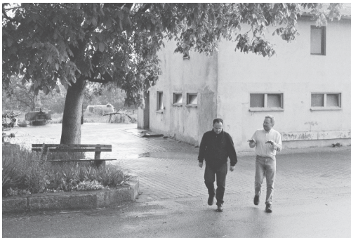
Als Landwirt (2007)

solchen Dahlienschau gibt nicht unbedingt einen repräsentativen oder möglicherweise gewünschten Querschnitt wieder. Das war 2014, der 3. Oktober 2014, also wenige Monate bevor sich viele Menschen hier nach Europa aufgemacht haben. Die Gespräche sind fast unverändert im Film, besonders das erste mit allen Sprech- und Atempausen. Gewagt habe ich diesen weitergehenden Schritt bei der Aufnahme und Montage zum einen nach dem Film STRAUB (2006–2014), der über einen langjährigen malerischen Erinnerungs- und Vergegenwärtigungsprozess das Werk von Jean-Marie Straub und Danièle Huillet aus einer persönlichen Perspektive betrachtet, und zum anderen aufgrund der Erfahrung mit den davor gemachten Gesprächsfilmen, die Erzählungen jeweils unterschiedlich zueinander in Beziehung setzen. Dahlienfeuer verdichtet weniger. Als Zuschauer kann man quasi live überprüfen: Wie passiert zum Beispiel die Zusammenarbeit mit der Kamerafrau Bernadette Paaßen und dem Tonmann Achim Burkart? Wann wird welche Frage wie gestellt?