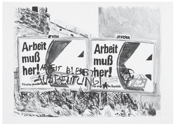
Malerei heute (2005)

Aquarellmalerei ist nicht leichter als Ölmalerei und sehr besonders. Das sieht man an den Aquarellen von Hopper, Porter und vielen anderen. Es dauert, bis ein Aquarell trocknet, besonders wenn man es im Freien sehr flüssig malt. Beim Trocknen passiert viel. Das Öl erscheint weiterhin in einem gewissen Sinn nass, beim Aquarell kann man beim Warten aufs Trocknen beobachten, wie das, was man der Wirklichkeit entnommen hat, in gewisser Weise verblasst oder sich