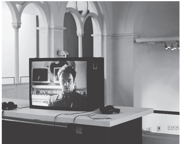
Ein Film über den Arbeiter (1997)

Jede Verständigung, auch unser Gespräch, will ja in Gang gebracht werden, oder? Das Intentionale, Provokatorische ist sicher eine große Frage. Es gibt zwei Bücher des Psychoanalytikers Aron Bodenheimer: Warum? Von der Obszönität des Fragens und Verstehen heißt antworten . Schon die beiden Titel weisen auf etwas hin, über das es sich nachzudenken lohnt. Es geht mir nicht darum, Polemiken zu wiederholen gegen „Interviewtechniken“, wie sie an Film- und vielleicht auch Journalismushochschulen